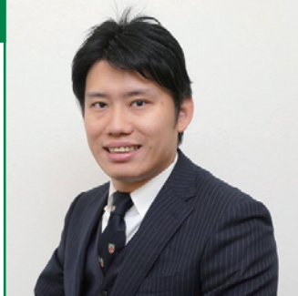
第50回青年経営者全国交流会 実行委員長

これまでの歴史に感謝し、記念すべき第50回大会を節目に、中同協青年部連絡会2030VISIONの実現に向け「圧倒的な発想転換」で青年経営者全国交流会の新たなステージを創ります。第1回青全交を開催した兵庫の地で、全国の仲間と共に新たな未来を切り拓きましょう！