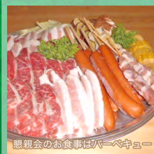
懇親会のお食事はバーベキュー