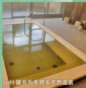
pH値 8.5 を誇る天然温泉