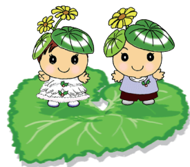
社会福祉法人つわぶき会マスコットキャラクター「つわちゃん」と「ふぎちゃん」

障がい者雇用創造部会の発起人メンバーであり、和歌山県中小企業家同友会の発展にも寄与され、平成26年に社会福祉法人つわぶき会・哲人会理事長に就任。従業員数200名を超える大きな社会福祉法人へと成長させ、その人望から障害福祉を中心とした様々な組織の公職を担う。